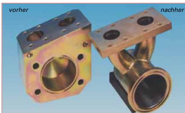
Die alte Ausführung wog 25 kg, die neue optimierte Version wiegt 5,2 kg