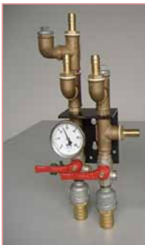
Ablösung von Fittings