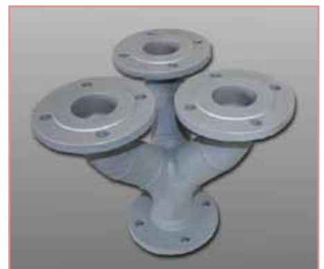
Rohrverteiler in einem Stück