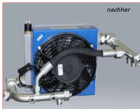
Optimierungen an einem Öl-Luft-Wärmetauscher