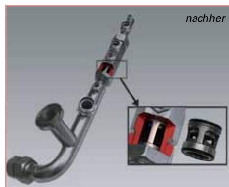
Verschraubungsablösung, neue Version mit Rückschlagventil