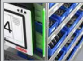
LED Leuchtbänder für RFID-Regalsysteme mit Signal-Ton

Vielfältige Möglichkeiten, die für Ordnung und Übersicht in Ihrer Produktion sorgen.