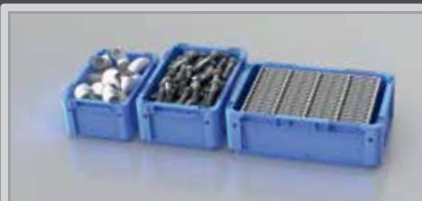
BITO Euro-Stapelbehälter für Zwei- und Mehrbehälter-Kanban

Maße RK 5109 (LxBxH): 500 x 117 x 90 mm Maße RK 5209 (LxBxH): 500 x 234 x 90 mm Farbe: Blau