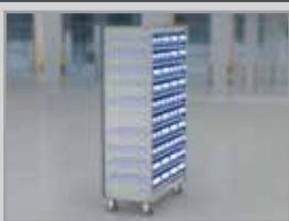
Kanban Rollwagen für Ein-Behälter-Kanban

Regalhöhe: 1850 mm Regalbreite und -tiefe: 1058 x 524 mm Nutztiefe: 500 mm Anzahl Fachböden: 14