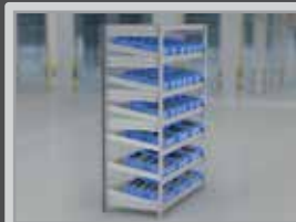
Standregal für Zwei- und Mehrbehälter-Kanban

Regalhöhe: 1815 mm Regalbreite und -tiefe: 1068 x 533 mm Nutztiefe: 500 mm Anzahl Fachböden: 10