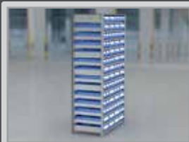
Standregal für Ein-Behälter-Kanban

Regalhöhe: 1850 mm Regalbreite und -tiefe: 1058 x 524 mm Nutztiefe: 500 mm Anzahl Fachböden: 14