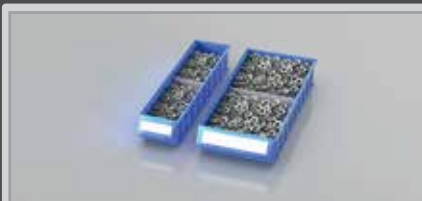
BITO Regalkästen für Ein-Behälter-Kanban

Regalhöhe: 2000 mm Regalbreite und -tiefe: 1358 x 624 mm Nutztiefe: 600 mm Anzahl Fachböden: 7