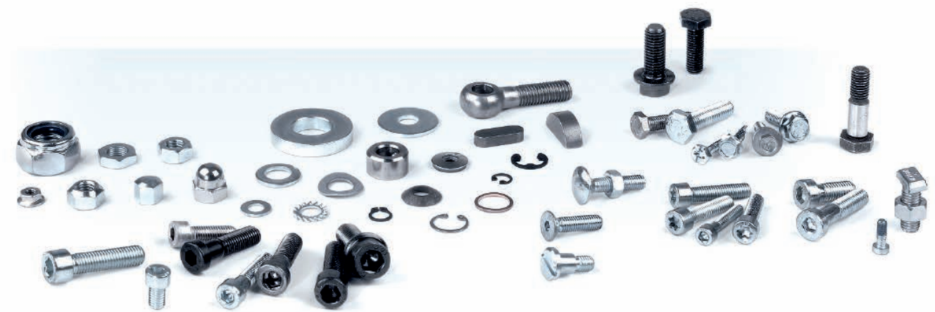
Allrounder: Maschinenbau, Windkraftwerke, Luft- und Raumfahrt? Die Schrauben, Muttern, Rohrbögen oder Formdrehteile von Otto Roth finden vielseitig ihren Einsatz

ScrewClip kann überall dort zum Einsatz kommen, wo eine Schraubenverbindung für Wartungszwecke gelöst werden muss. Schnell und einfach rüsten Anwender die Verbindungslösung nach. Es bestehen keine Einschränkungen beim Anzugsmoment oder bei der Festigkeitsklasse der Schraube. Beim Einsatz fallen keine konstruktiven Änderungen an der Maschine an. Die Unverlierbarkeit des ScrewClip ist durch die Dekra bestätigt. »Unser Produkt lässt sich einfach bedienen. Es ist derart flexibel, dass es über Eck befestigt werden und sogar verdreht zum Einsatz