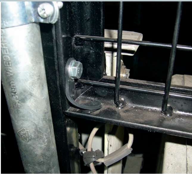
Anpassungsfähig: Die Schrauben-Verliersicherung ›ScrewClip‹ lässt sich auch über Eck befestigen